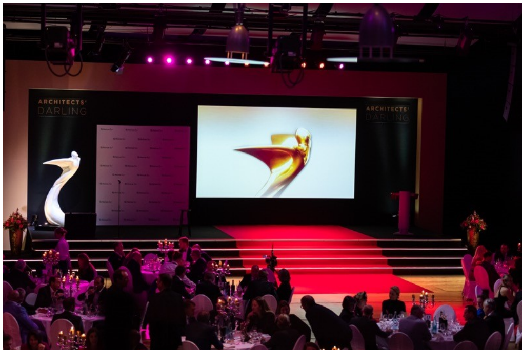
Zur feierlichen Gala der Heinze Architects' Darling Awards 2021 kam am 9. November 2021 das Who's Who der Baubranche in Celle zusammen.

Girnguber GmbH Ludwig-Girnguber-Straße 1 84163 Marklkofen